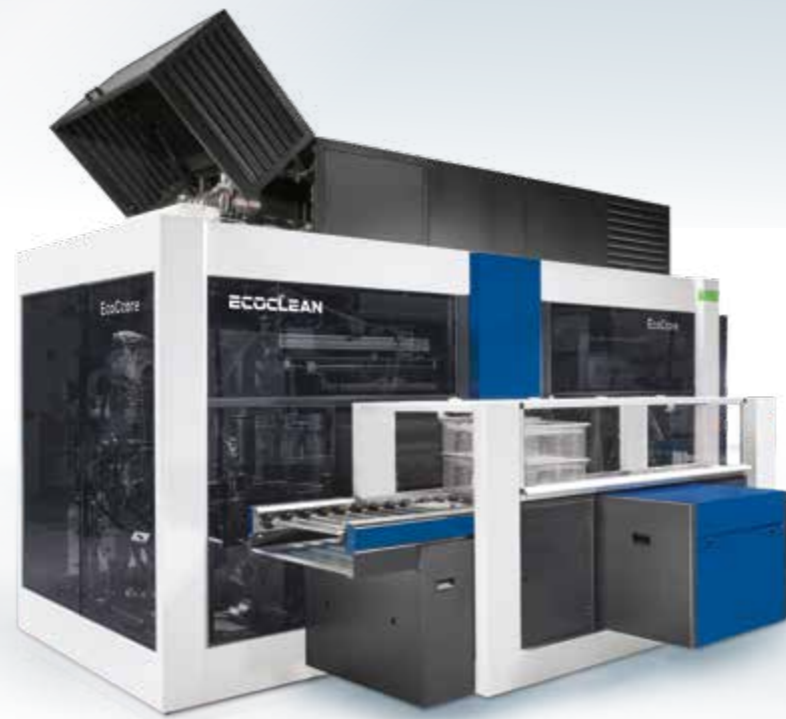
➤ EcoCcore – la nuova dimensione nel lavaggio con solventi